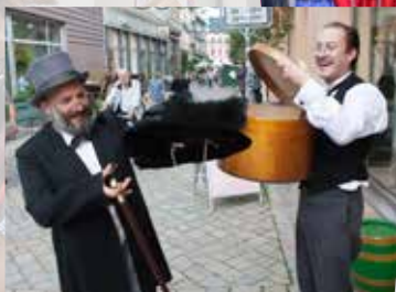
Historisches Einkaufserlebnis in der Steinbrücke