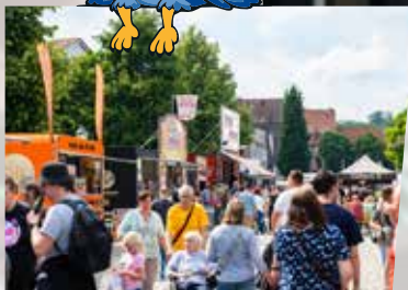
Food-Trucks in der Carl-Ritter-Straße

An den außergewöhnlichen Imbissständen zeigt sich die Vielfalt der internationalen Esskulturen. Lassen Sie sich von Düften verführen, probieren Sie sich durch die Welt und entdecken Sie spannende Geschmackskombinationen - ein echtes Erlebnis für alle Sinne!