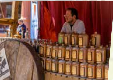
Mittelaltermarkt im Wordgarten